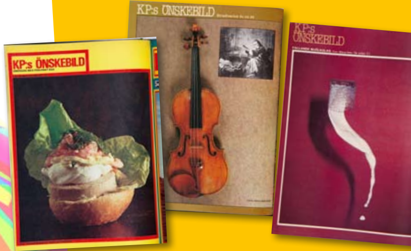
En del önskebilder genom åren har varit lite udda... Eller vad sägs om Smörgås med förlorat ägg, Stradivarius-fiol och fallande mjölkglas?