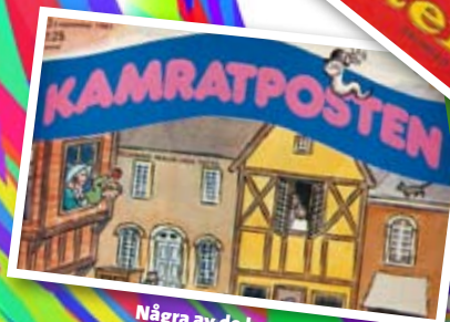
Några av de loggor som KP haft genom historiens virr-varr.