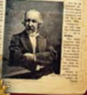
Första numret någonsin!

8 sidor. Men nummer två började med sidan 9, och så vidare. Så i slutet av året hade läsarna samlat ihop flera hundra sidor av "boken som aldrig tar slut".