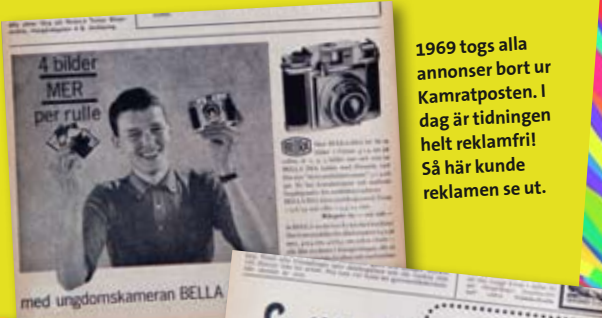
1969 togs alla annonser bort ur Kamratposten. I dag är tidningen helt reklamfri! Så här kunde reklamen se ut.