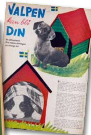
Det var fina priser i tävlingarna för 60 år sedan. Här en hundvalp!

Sedan var man vuxen. Nu uppstod ungdomskulturen, och modeskapare designade tonårskläder. Tonåringar började lyssna på annan musik och fick andra idoler än vuxna. Detta märktes i KP. Plötsligt skrevs artiklar om hur man piffar upp sitt rum och syr egna kläder. Men andra ämnen, som puberteten och politik, skrevs det aldrig om. ■